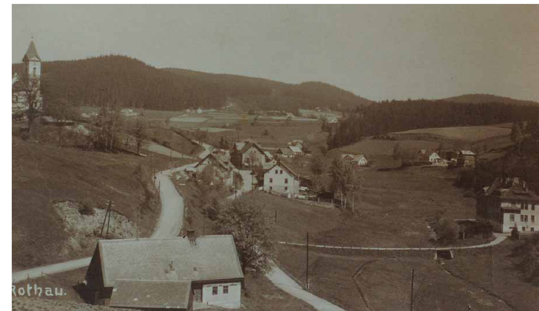
Winklov a Křižovatka kolem 1930 / Winklau und Kreuzweg um 1930

Unser Weg führt nun zu der Häusergruppe „Kreuzweg“. In ihrer Mitte kreuzte die neuere Příbramská Straße (Untere Straße) den uralten Handelsweg, jetzt das Sträßlein U Kostela (Obere Straße), welches uns zur Kirche führt.