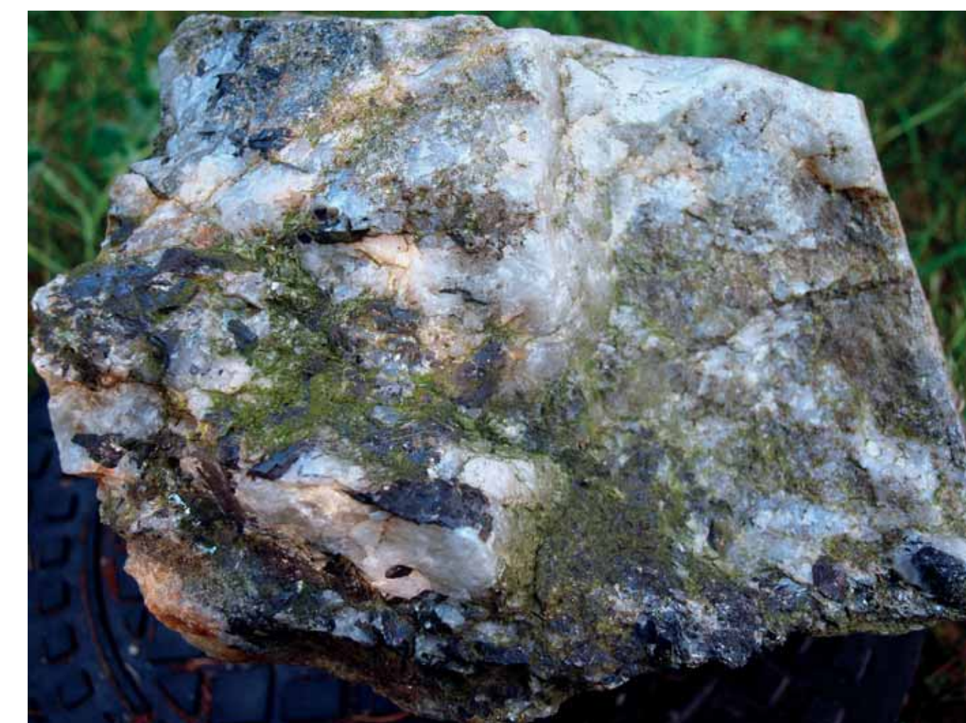
Wolframit z Rotavy (černé krystaly) / Wolframit aus Rothau (schwarze Kristalle)