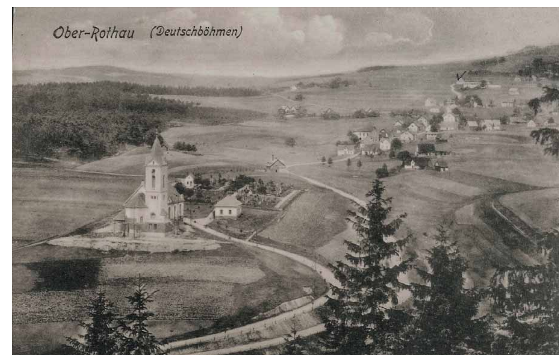
Pohled ze Skalky na kostel se starým hřbitovem / Blick von Felsl auf die Kirche mit dem alten Friedhof