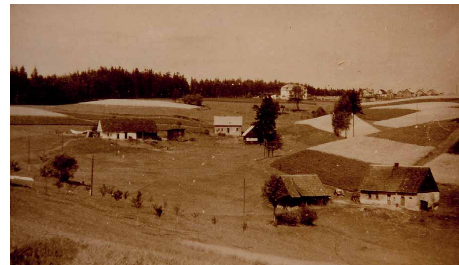
Pohled kolem 1930 do Nosatky (Baderloch), v pozadí uprostřed obecní chudobinec a vpravo sídliště Haar / Blick um 1930 ins Baderloch, im Hintergrund das Armenhaus und die Siedlung Haar