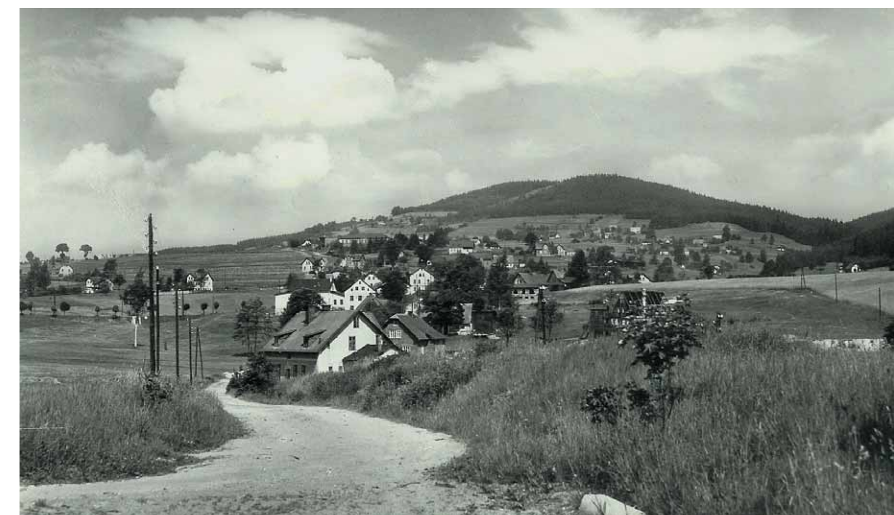
Pohled kolem 1960 do Příbramské ul. a na Sklenský vrch (Glasberg, 816 m), vpředu vpravo býlo wolframový důl / Blick um 1960 in die Peint (Příbramská Str.) und zum Glasberg (816 m ü. NN), im Vordergrund der ehem. Wolframschacht