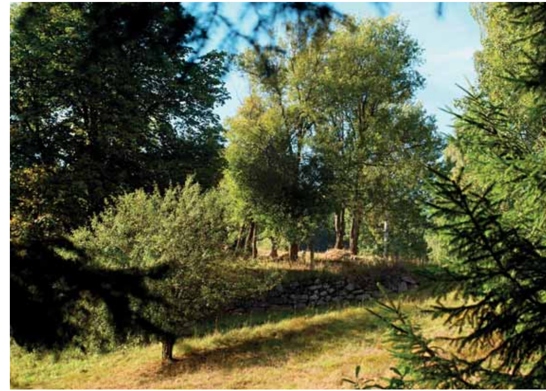
Bývalý Dolní Statek / ehem. Unteres Gut

Sluníčko vzniklo adaptací bývalé hraběcí hájovny Amálka (Forsthaus Amalien, Amalienforsthaus, Amalien Försterhaus), která patřila do roku 1925 hraběti Nosticovi. Hájovna byla jedním ze čtveřice domů na východním konci Rotavy, které skládaly sídelní jednotku Horní Statek (Oberes Gut). Na okraji lesa stojí ještě jedno rekreační stavení, ale zbořeniny dalších domů zarůstá les.