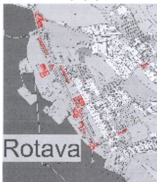
Příloha č. 2